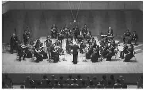
OLC第39回定期演奏会 三鷹市芸術文化センター(2017.6.24)